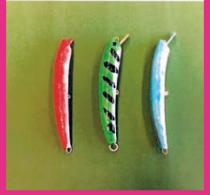
Fischköder herstellen und testen

Diese Woche habe ich die Erklärung nicht so toll gefunden.