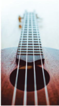
Mein Ukulele Song